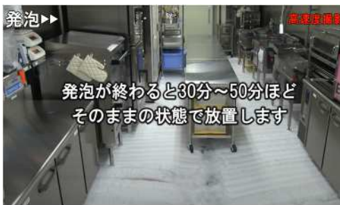
床面自動泡洗浄システム / アワフル

お客様のオーダーと連動し、炒め料理なら食材のピックアップから、盛り付けまでを完全自動で行える厨房機器。