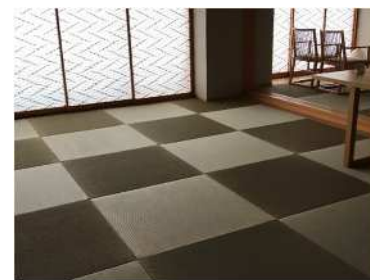
定額畳張替え / 菊屋【タミス】

美容家電、マッサージ器、シャワーヘッド。客室に、常に最新モデルを設置できるレンタルサービス。差別化したリラククス体験提供の一助に。