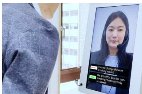
遠隔接客サービス RURA / タイムリーブ

本邦初！エレベータ自動昇降ロボット。清掃ロボット・配送ロボットなど、フロアを跨ぎ活躍。