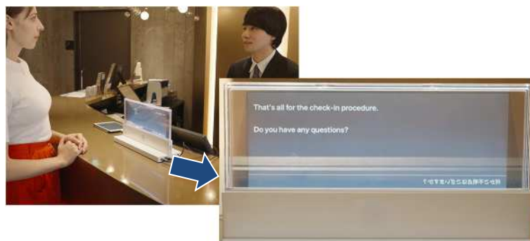
KOTOBAL×透明ディスプレイ / コニカミノルタ

モニター越しにチェックイン・アウトをサポート。センター設置で効率的なサービス提供を実現。新たな職場設置で人材確保に寄与。多言語対応可。