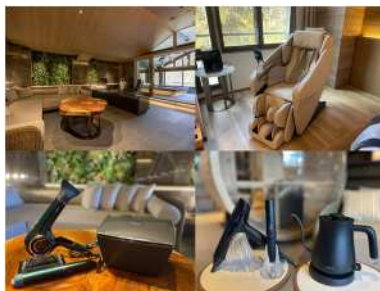
高級家電レンタル / アリススタイル

全国の職人による和食器を月額サブスクでレンタル。季節に合わせた使い分けを実現し、ストックを減らす。気に入ったものは購入も。