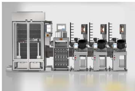
Hestia 自動調理器 / Hestia Robotics

お客様のオーダーと連動し、炒め料理なら食材のピックアップから、盛り付けまでを完全自動で行える厨房機器。