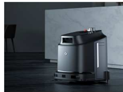
エレベータ昇降ロボット / ミライト・ワン

飲食店・スーパーなどの厨房の床面洗浄をボタンひとつで完了。殺虫・防虫対策にも。人手不足の昨今問合せ殺到中。