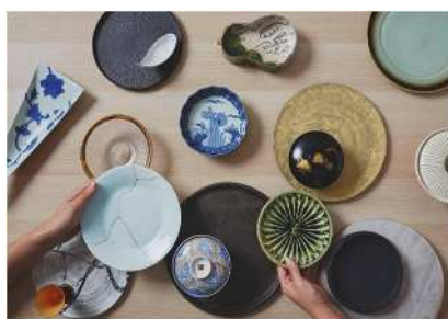
和食器サブスク / クラフトル

全国の職人による和食器を月額サブスクでレンタル。季節に合わせた使い分けを実現し、ストックを減らす。気に入ったものは購入も。